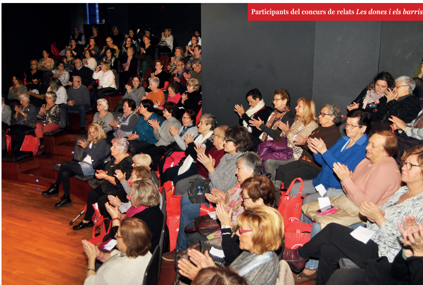
Participants del concurs de relats Les dones i els barris

La participació de les dones ha augmentat any rere any, i les actuacions directes amb el col·lectiu i el grau de satisfacció han demostrat la necessitat de continuïtat. Els tallers d'alfabetització i escriptura, i els grups de lectura han facilitat la participació de les dones al concurs de relats breus. Però més enllà, des de la FAVIBC volem impulsar noves iniciatives que ajudin a donar visibilitat i a treballar la inclusió, atès que els masclismes i els antifeminismes atempten directament contra molts col·lectius. Les actituds antifeministes i homòfobes augmenten i, més concretament, entre els estrats joves de la nostra societat a través de les noves tecnologies, que són els seus canals quotidians d'informació.