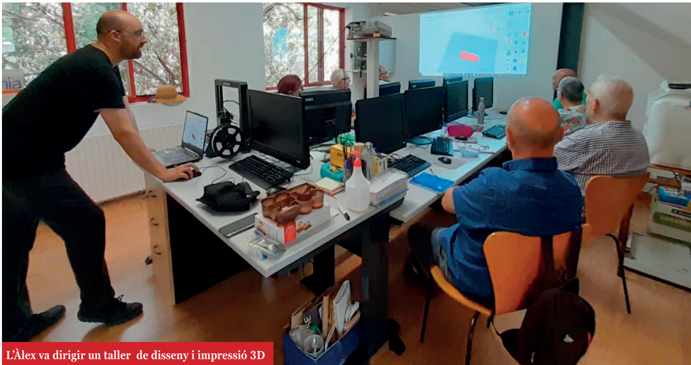
L'Àlex va dirigir un taller de disseny i impressió 3D

I aquí entrem nosaltres i la sinèrgia amb altres entitats del territori. Amb la seva expertesa i recursos arribem molt més lluny. En aquesta sentit, darrerament hem enfortit les col·laboracions amb Torre Barrina, una institució municipal especialitzada en l'àmbit de la Innovació Social. L'interès és bidireccional, ja que ens nodrim mútuament.