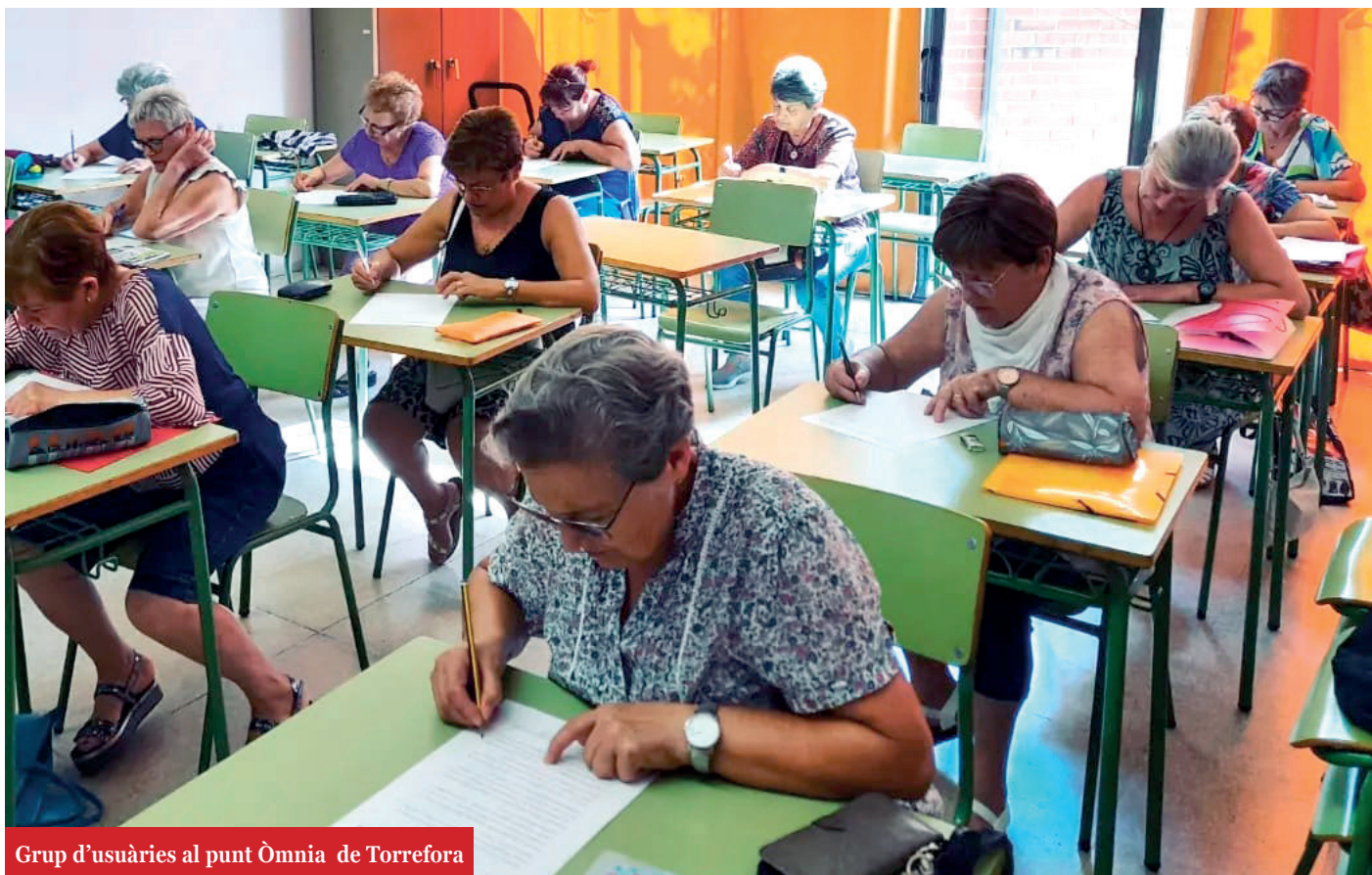
Grup d'usuàries al punt Òmnia de Torreforta

Com és habitual, cada matí m'encarregava de preparar les meves activitats. Des de la taula del meu ordinador veia entrar a la resta de persones que treballen en el Centre Cívic. Sempre he pensat que soc molt afortunada de poder tenir el Punt Òmnia aquí, ja que em permetia poder tenir un gran ventall de col·lectius on poder oferir tot tipus d'activitats. Si alguna cosa caracteritza la nostra feina és justament d'això, atendre a persones, ja sigui individual o col·lectivament, i el contacte amb aquestes és el més enriquidor del nostre sector laboral. En el punt era un entrar i sortir de persones constant, un punt de trobada on cada persona tenia la seva història.